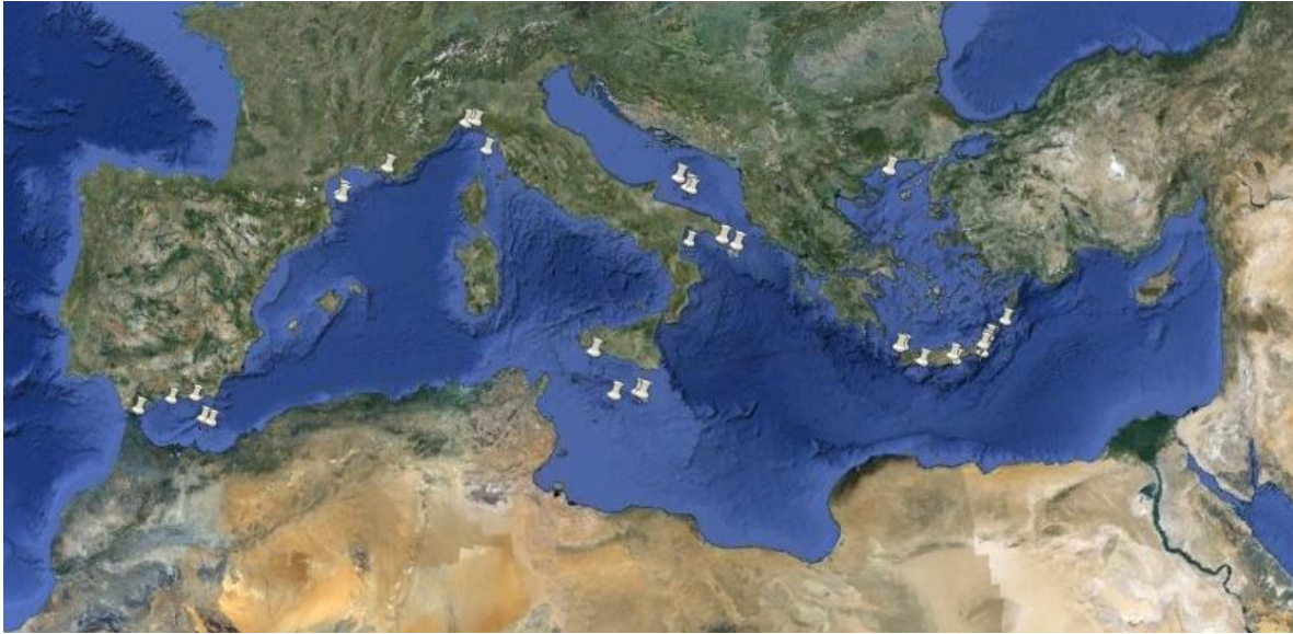
Figure 2: Localisation de quelques peuplements d'invertébrés structurants en Méditerranée. Ce sont majoritairement les « coraux d'eaux profondes » qui sont localisés (d'après auteurs du document &[8], [9], [10].

Aussi, leur présence peut être un préalable nécessaire à la mise en place de mesures de gestion spécifiques. S'ils sont actuellement encore peu pris en compte, en terme de conservation, puisque seul le « récif à Lophelia et Madrepora » de Santa Maria de Leuca est inscrit comme zone de pêche restreinte par la CGPM, depuis 2006[11], ils sont à l'origine de la création d'AMP (e.g. canyons de Cassidaigne et Lacaze-Duthiers - France). De même, deux sites ont été désignés, à ce titre, par l'Italie (Pentes continentales de l'Archipel toscan et secteur de Santa Maria de Leuca) pour la mise en œuvre du réseau Natura 2000 en mer et plusieurs sont inclus dans la proposition de mise en place d'un réseau représentatif d'AMP en mer d'Alboran [6].