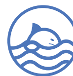
Poissons cartilagineux (Chondrichthyens)