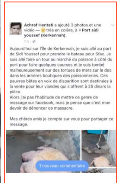
Planche 1 : Photos et séquences vidéo et échanges d'emails à propos de braconnages et d'abatage de tortues marines