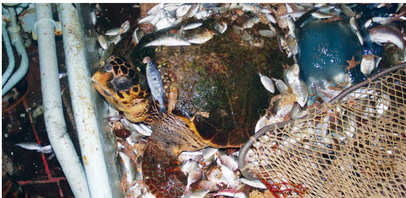
Pêche avec Chalutiers

Ce qui est important à signaler pour cet engin de pêche c'est l'importante mortalité directe. La noyade est la raison principale de mortalité des tortues marines induite par ces engins de pêches : les animaux emmêlés dans le filet, ne peuvent plus atteindre la surface pour res-