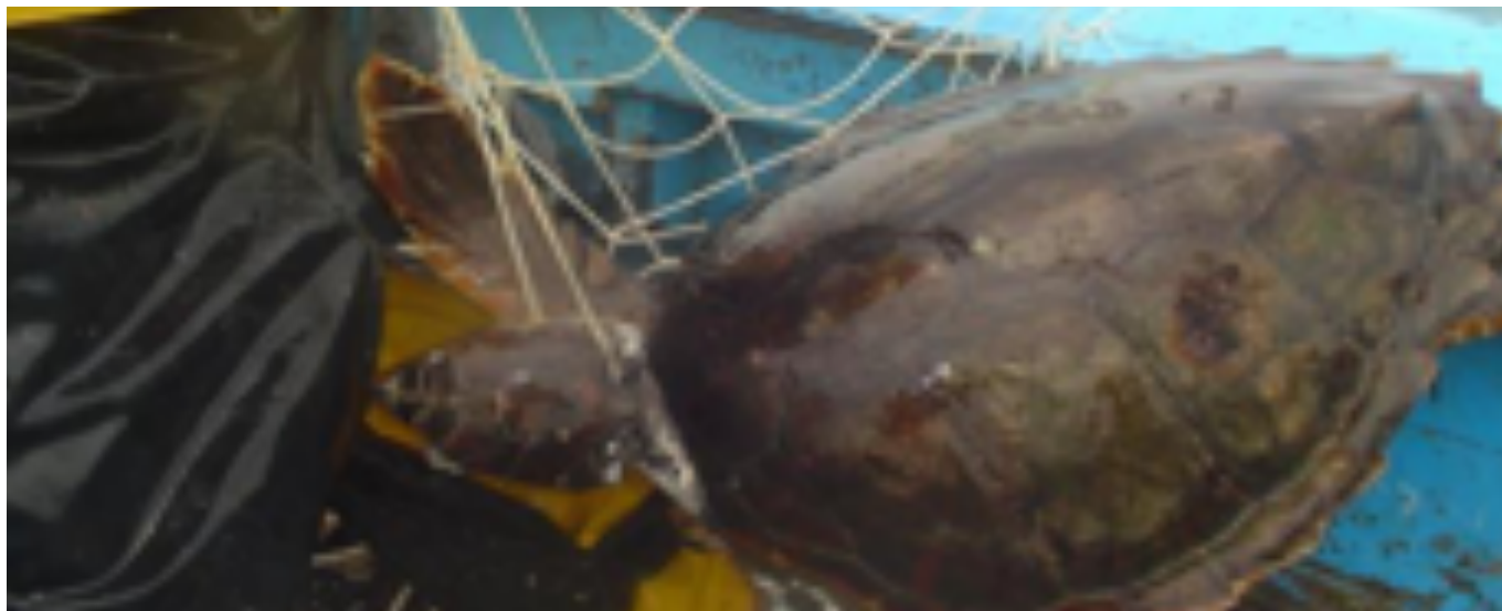
Pêche avec filets maillants

filets maillants représente un grand danger pour la population des tortues marines puisque cette technique est pratiquée généralement à des faibles profondeurs où la densité des tortues marines est importante. Le tableau 1 résume les données sur l'ampleur de la pêche accidentelle des tortues marines dans le Golfe de Gabès (Tunisie).