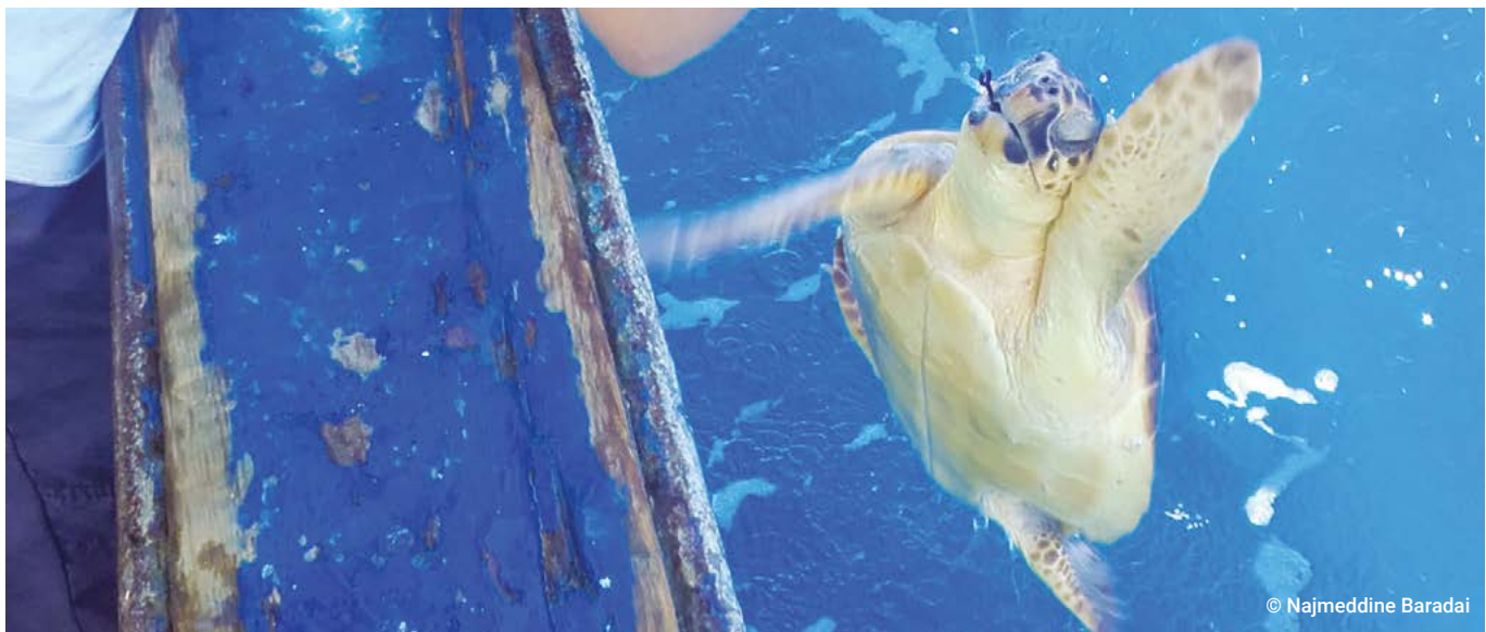
Pêche avec palangres de fond

Durant 96 traits effectués, les tortues marines ont représenté 3,7 % du nombre de prises (0,25 ind/1000 h) des palangriers de surface durant la période