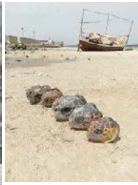
Kerkennah Sidi Youssef