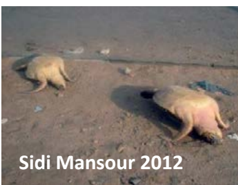
Sidi Mansour 2012