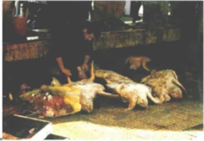
Abattage de tortues caouannes dans le marché Bab Jebli (Sfax) en hiver 1988. Pendant l'hiver environ 40 tortues sont abattues chaque jour pour la viande et la carapace.