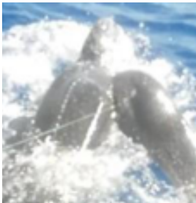
Pêche avec palangre de surface

Les captures dans le Golfe de Gabès, comme il a été montré dans plusieurs régions du monde, sont plus abondantes dans les faibles profondeurs (<50 m), zone en principe interdite au chalutage benthique. L'application de la législation en vigueur pourrait bien atténuer ces interactions.